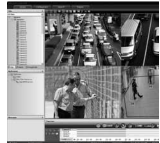
Клиентская рабочая станция