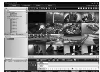
Клиентская рабочая станция