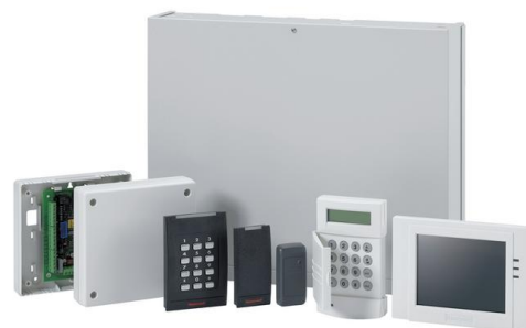
Система Galaxy Dimension

Высокая производительность при работе с большим количеством шлейфов - отличительная особенность системы Galaxy. Управление контрольной панелью, изменение настроек и данных пользователей осуществляется практически мгновенно, без задержек , которые обычно свойственны системам других фирм-производителей.